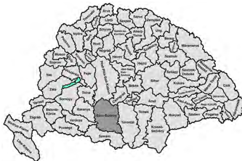
Bács-Bodrog vármegye és Baja elhelyezkedése a Magyar Királyságon belül