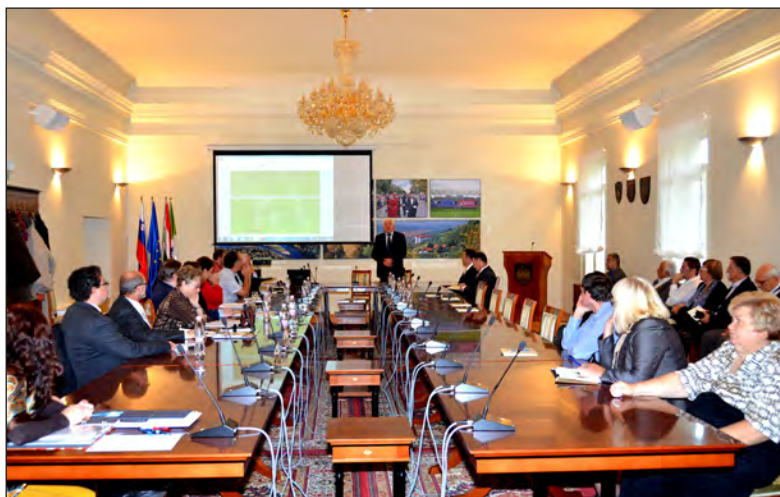
A konferencia résztvevői