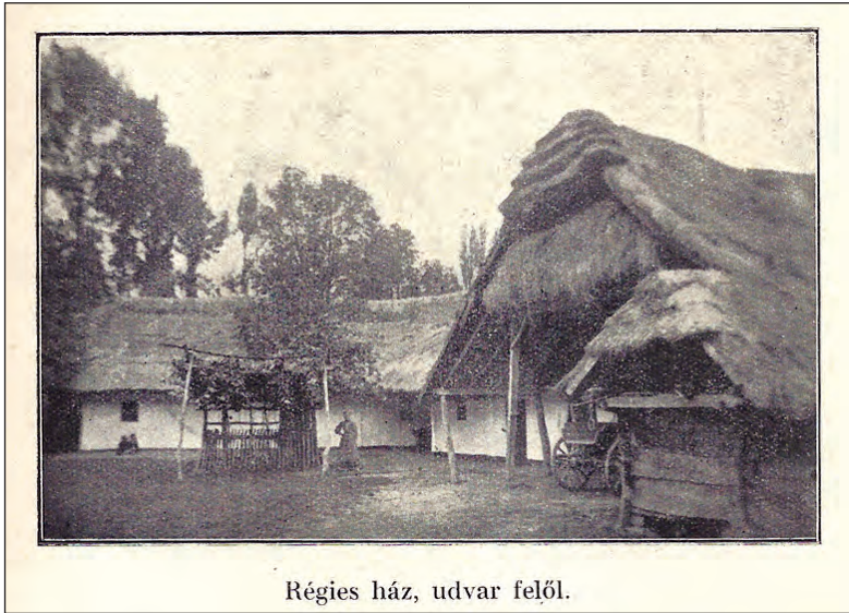
Régies ház, udvar felől.

Gönczi Ferenc: A zalamegyei vendek. Kaposvár, 1914. 21.