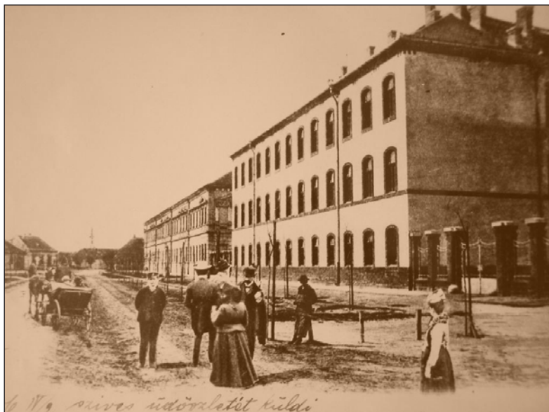
A Tanítóképző a frissen átadott internátussal

A rendszeresen megjelenő évkönyvben legalább egy tudományos cikk is napvilágot látott a tanárok tollából. Ilyen oktatási és szellemi műhelybe könnyen be tudott illeszkedni a fiatal kolléga.