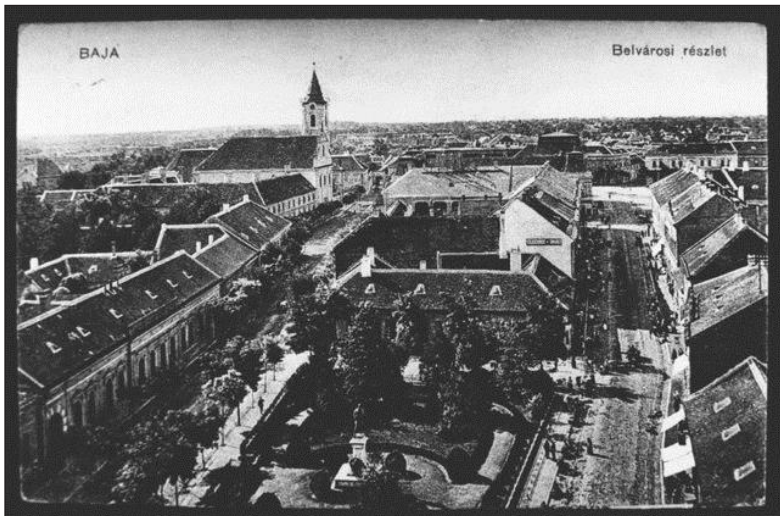
Baja belvárosa a századfordulón

A nagyszámú zsidó lakos magyarnak vallotta magát, és a bácskai mezőgazdasági termékek begyűjtésével és továbbításával, valamint a városi életmódot kiszolgáló üzletek működtetésével foglalkozott.