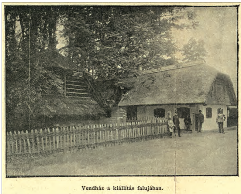
A szlovén ház a millenniumi faluban

(Bellosics 1896b, ill. Katona József Múzeum, Kecskemét, 452.87.)