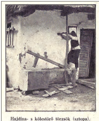
Hajdina- s kölestörő törzsök (sztopa).

Gönczi Ferenc: A zalamegyei vendek. Kaposvár, 1914. 20.