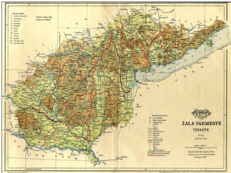
2. ábra Zala vármegye

Bellosics Bálint munkásságában kiemelkedő jelentőségű a tájhoz való kötődés, a szülőföld és a későbbi lakó- és munkahely megjelenése.