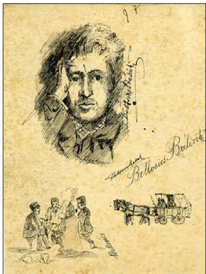
Bellosics önarchépe Katona József Múzeum, Kecskemét

hanem általában a korról, a századvég és a századelő állapotairól, a korabeli társadalom és főként a kibontakozódó néprajztudomány helyzetéről, valamint arról a kapcsolatrendszeréről, amely végigkísérte pályafutását. Az alkalmi és az állandó levelezőtársak Bellosics számára fontos kortársak, szakmai példaképek, tanítványok és munkatársak, azok az emberek, akik fontosak voltak az életében és munkájában. A kortársakról, akik azokban az években hasonló céloktól és eszméktől vezérelve végezték munkájukat, a teljesség igénye nélkül szólunk majd.