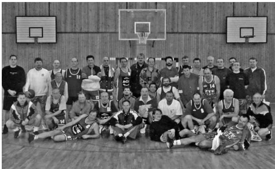
Udeleženci turnirja v Lendavi, 2004