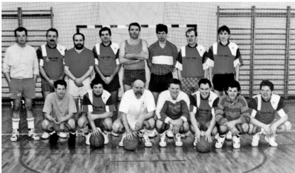
Moštvi Sobote in Lindaua leta 1985