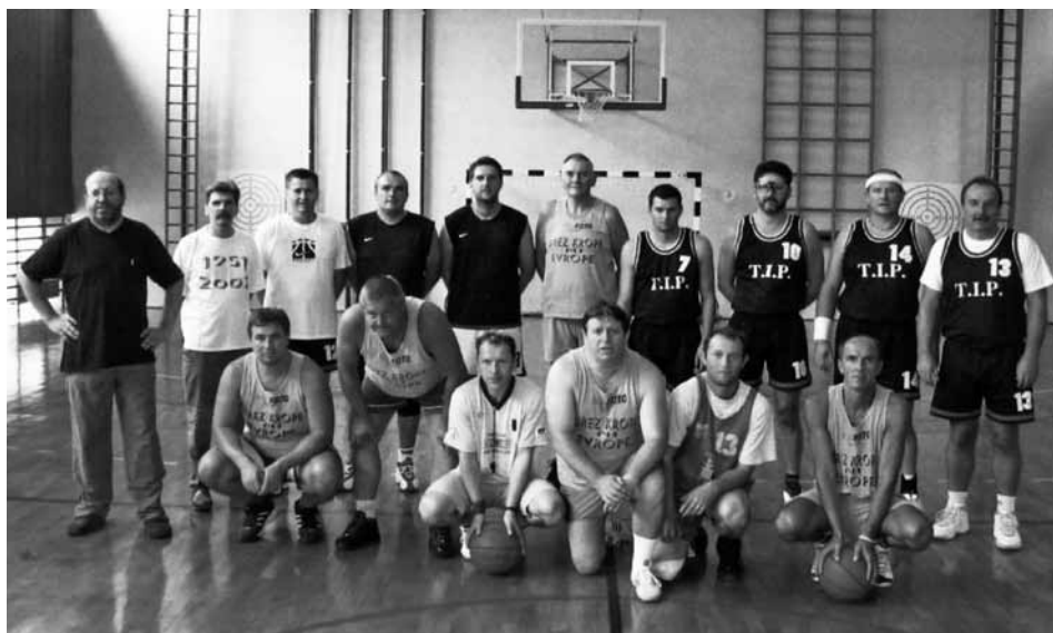
Člani KK Lindau leta 2005