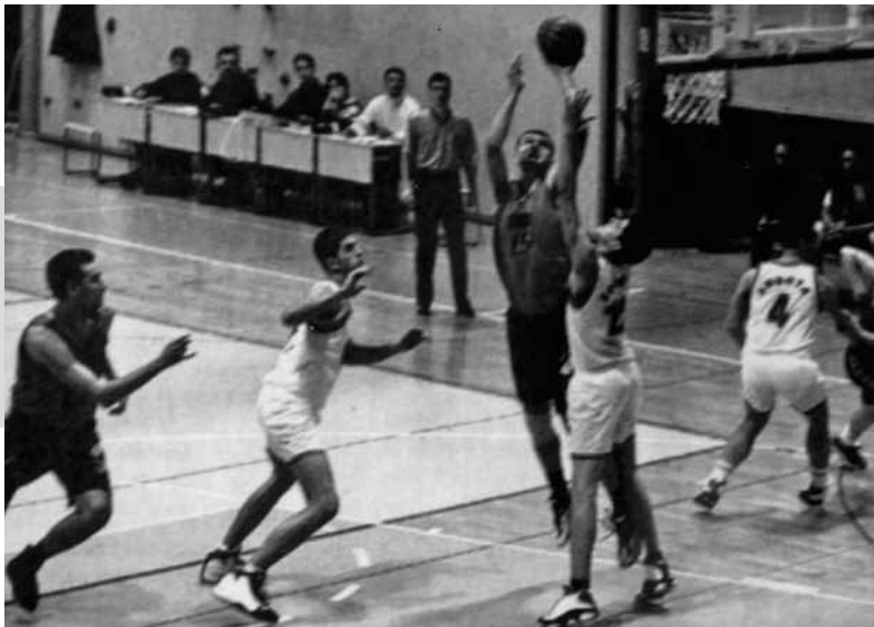
Trenutek srečanja med Radensko Creativ - Miarte Lindau