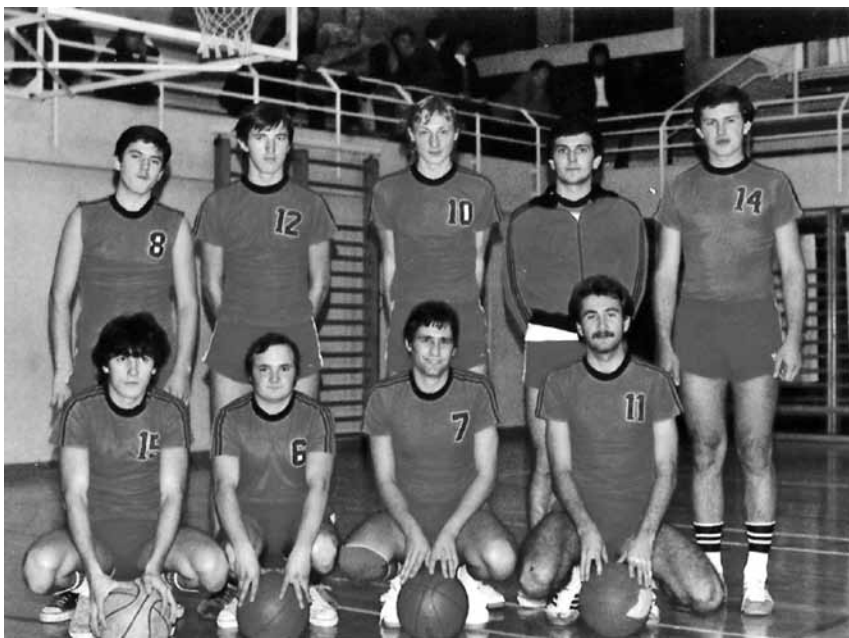
Moštvo KK Lindau 1978