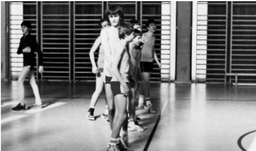
Pozdrav pred srečanjem