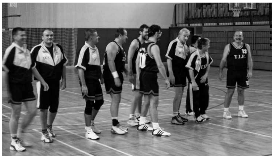
Veterani KK Lindau, 2005