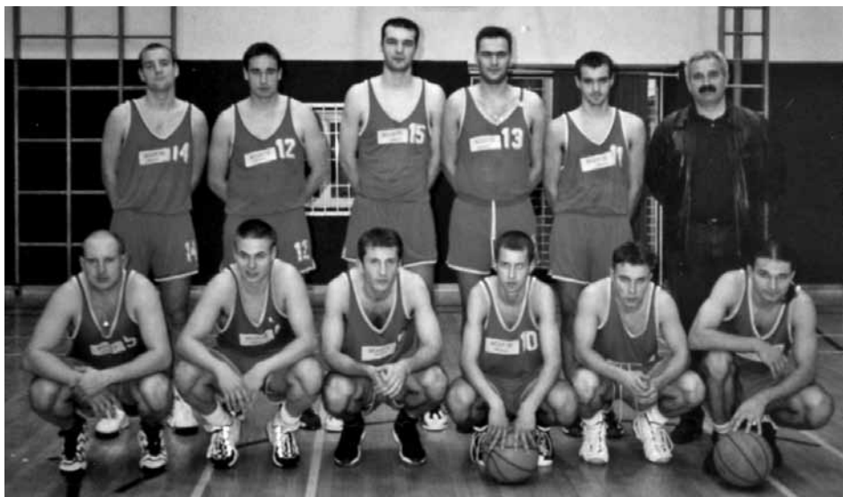
Moštvo KK Lindau leta 1996