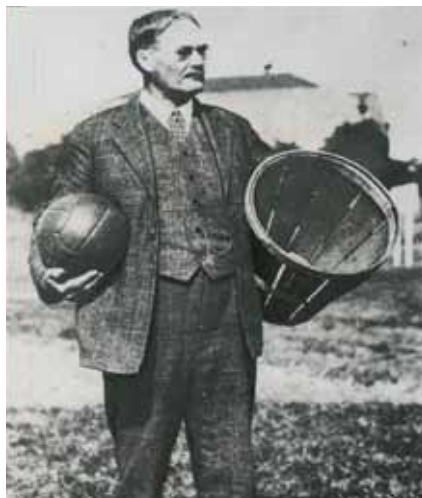
Ustanovitelj košarke, James Naismith

James Naismith se je rodil 6. novembra 1861 v malem mestecu Alanto, kakšnih 60 km vzhodno od Ottawe v Kanadi, kot sin Johna Naismitha in Margaret Young. V rojstnem mestu je do leta 1875 obiskoval osnovno šolo in tam 1883 končal tudi gimnazijo. Iste leta se je vpisal na univerzo McGill v Montrealu, kjer je diplomiral iz umetnosti. Med šolanjem se je ukvarjal z rugbyjem, ameriškim nogometom, igro imenovano »lacrosse« in s telovadbo. Po koncu prvega študija se je vpisal še na teološki kolidž v Montrealu, kjer je diplomiral leta 1890.