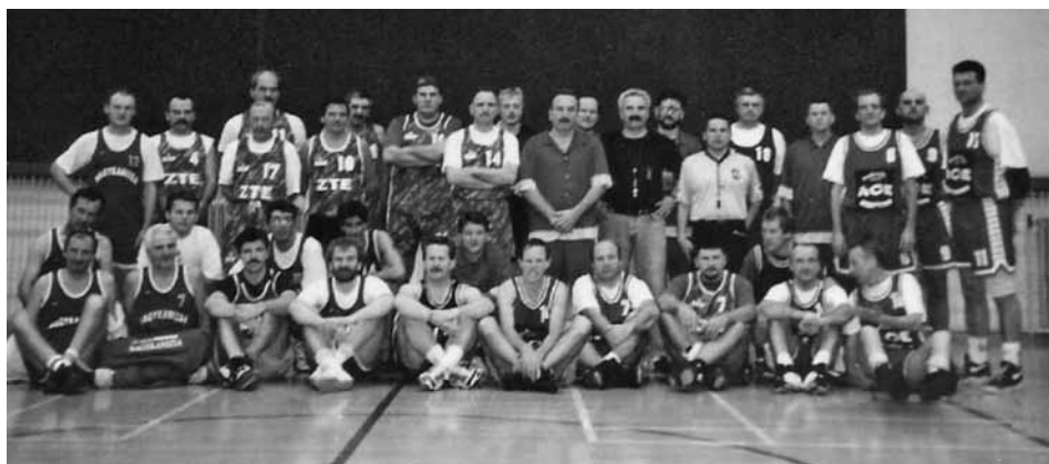
Udeleženci mednarodnega turnirja, 27. 11. 1999