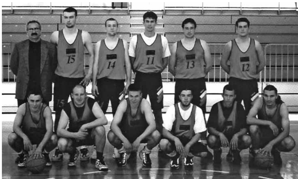
Člani KK Lindau leta 1997