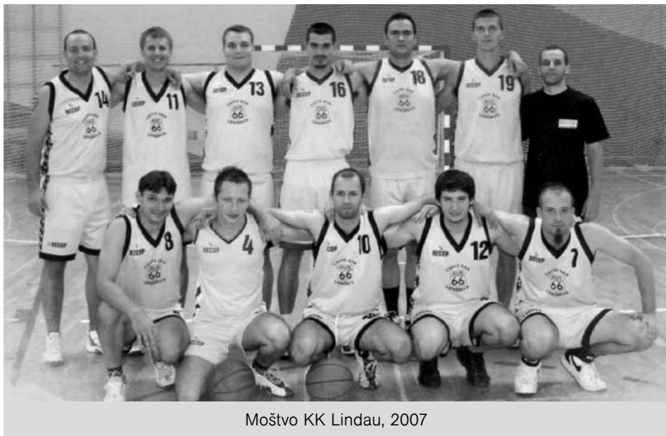
Moštvo KK Lindau, 2007