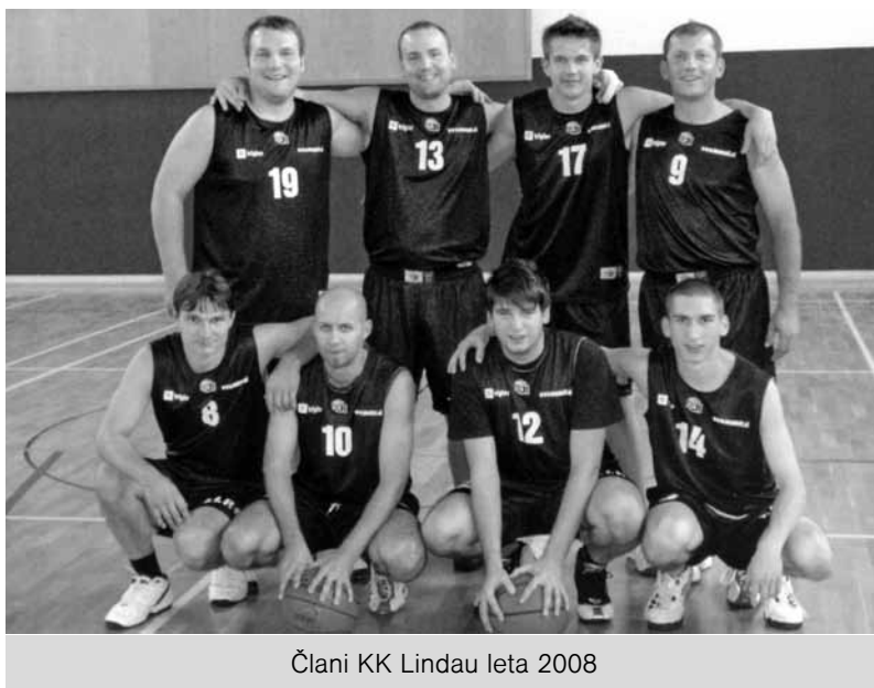
Člani KK Lindau leta 2008