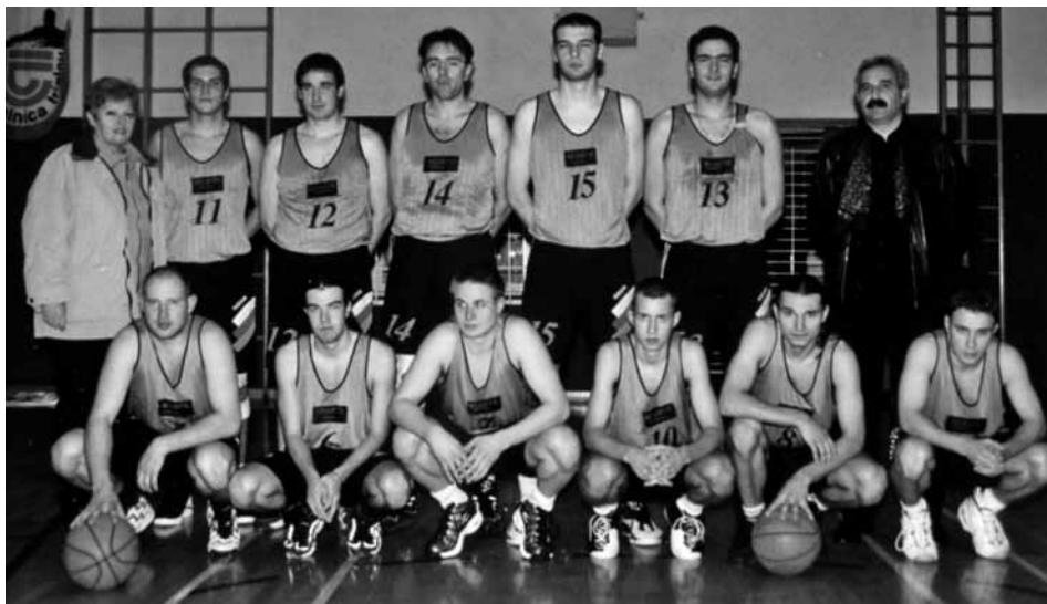
Člani tretje lige KK Miarte Lindau leta 2008