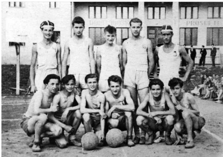
Moštvo KK Nafta 1948/49 pred zgradbo TVD Partizan