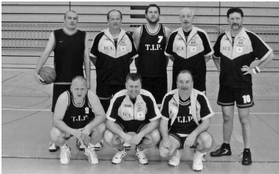
Člani tretje lige, KK Lindau 2008