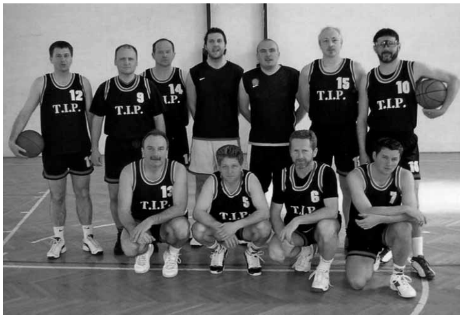
Veterani KK Lindau, 1998