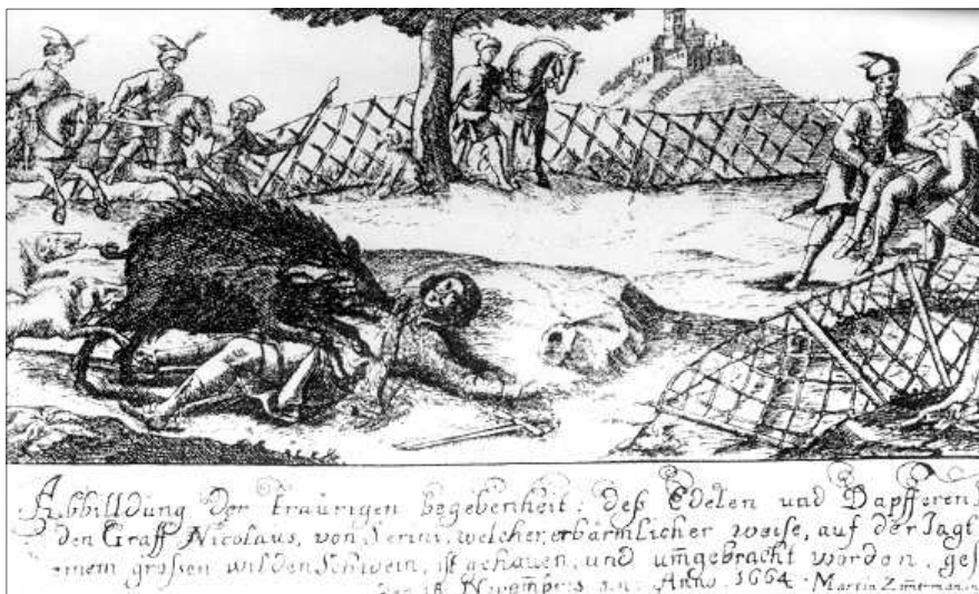
8. kép: Zrínyit végzetesen megsebzí a vadkan, bal lábszárán jól látható a seb.

fontos, hanem a különféle mendemondák eloszlatása is. „A nemzeti köztudatba szilárdan beépült »magyar hős–Habsburg orgyilkos« eszmei panelek gyakran elfedi a régenvolt események valódi lefolyását, megakadályozza a reális történelem- és nemzetszemléletet.” – írta Bene Sándor és Borián Gellért 11 Zrínyi és a vadkan című 1988-ban kiadott tanulmánykötetük fűszövegében. Szokoly Lajos a 19. század végén is érdekesnek tartotta Zrínyi Miklós rejtélyes halálát, amelyről 1894-ben három részből álló sorozatot közölt le a Muraköz hasábjain, 230 évvel a költő tragikus halála után.