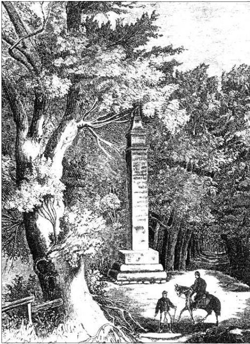
7. kép: A kursáneci emlékoszlop. Illusztráció Dervarics Kálmán Zrínyi Miklós halála című könyvéből, Szombathely, 1881

delmezése alatt magyar királlyá kiáltassa ki magát.” Zrínyi és a bécsi udvar között Zrínyi-Újvár eleste után megromlottak a kapcsolatok, Zrínyi Miklós hadvezér azt követően oppozíciónak számított. Nincs okunk kétségbe vonni a kutatók többségének egyetértését, hogy a XVII. század nagy fia valóban baleset áldozata lett. De megtalálhatók azok a legendák is a sajtóban, amelyek éppen ezt az állítást cáfolják. Ezeket sem szabadna elfelejteni. A történeti sorozatokban Zrínyi Miklós személyiségét a publicisták behelyezik a török ellenes harcokba. Ezekben a sorozatokban Zrínyi rokon viszonyait is felelevenítik, többször említik Zrínyi Iónát, Zrínyi Pétert és Rákóczi Ferencet is. II. Rákóczi Ferenc életének külön fejezeteket is szenteltek 1903–1904 között a Muraköz hasábjain.