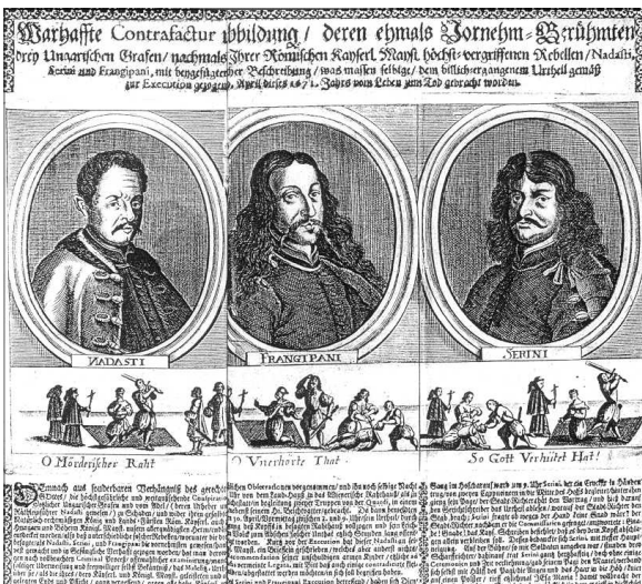
12. kép: A Habsburg-ellenes szervezkedés vezetői: Nádasy Ferenc, Frangepán Ferenc és Zrínyi Péter. I. Lipót nem kegyelmezett nekik, lefejeztette őket.

száműzetésben férje oldalán Nicodémiában 1703-ban. A költő egyetlen fia, Ádám Csáktornya felét kegyelemből utóbb visszakapja (Péter osztályrészét konfiskálták), s így utolsó birtokosa volt a várnak. Mint a királyi hadsereg vasasnémet alezredese, Zalánkemén mellett esett el 1691. augusztus 19-én 29 éves korában. Ádám halála után a nagynevű család egész birtoka a gráci belső-ausztriai kamara kezére került.