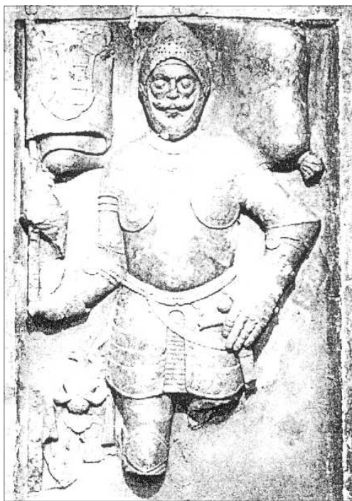
11. kép: A Zrínyi-sírkő Szentilonáról. 16–17. század, Csáktornya, múzeum

tették, s az egész családot kiirtották. Spankanék és büntársaik garázdálkodtak abban a várban, amely a Zrínyiek idejében a magyar szellem és a magyar kultúra valóságos fényforrása volt.