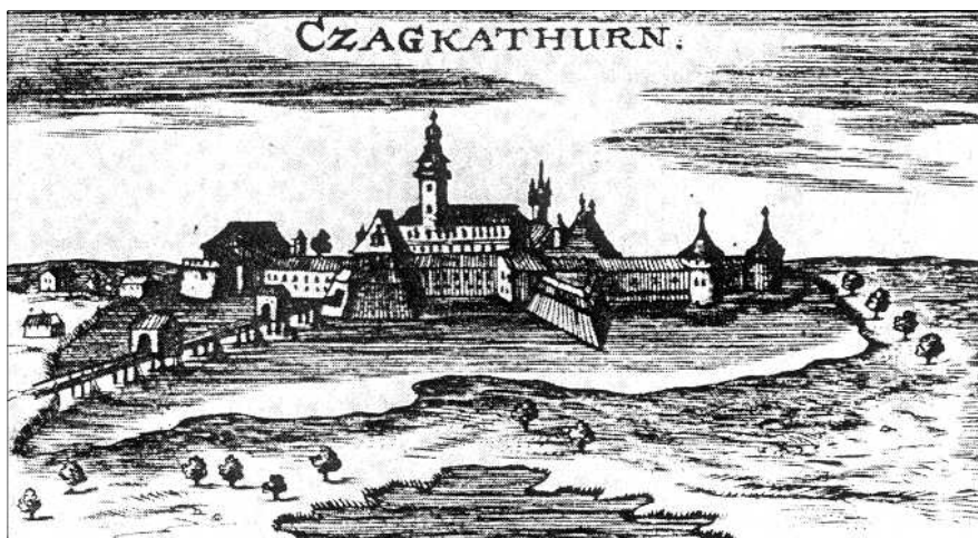
6. kép: Csáktornya látképe (XVII. század) – rézmetszet

A Muraköz 1882. június 5. IX. évf. 23. számában a Régi okiratok sorozatában jelent meg egy okirat, amelyben a muraközi nemesség és a vitézlő rendek 1631-ben húsvét táján levélben fordultak gróf Zrínyi Miklóshoz és gróf Zrínyi Péterhez, mert Csernko Gáspár otthona, va-gyona és jószága elégett, s ezért szükségesnek tartották a kártérítést. Továbbá Pápai Zakariás és Schittkovics Ferencz is kéréssel fordultak Bottyai Ferencz vitéz úrhoz, vagyis: „Kanizsa ellen vetett végh hazánknak vice Generálisához és Egerszegh végh háznak fő kapitányához.”