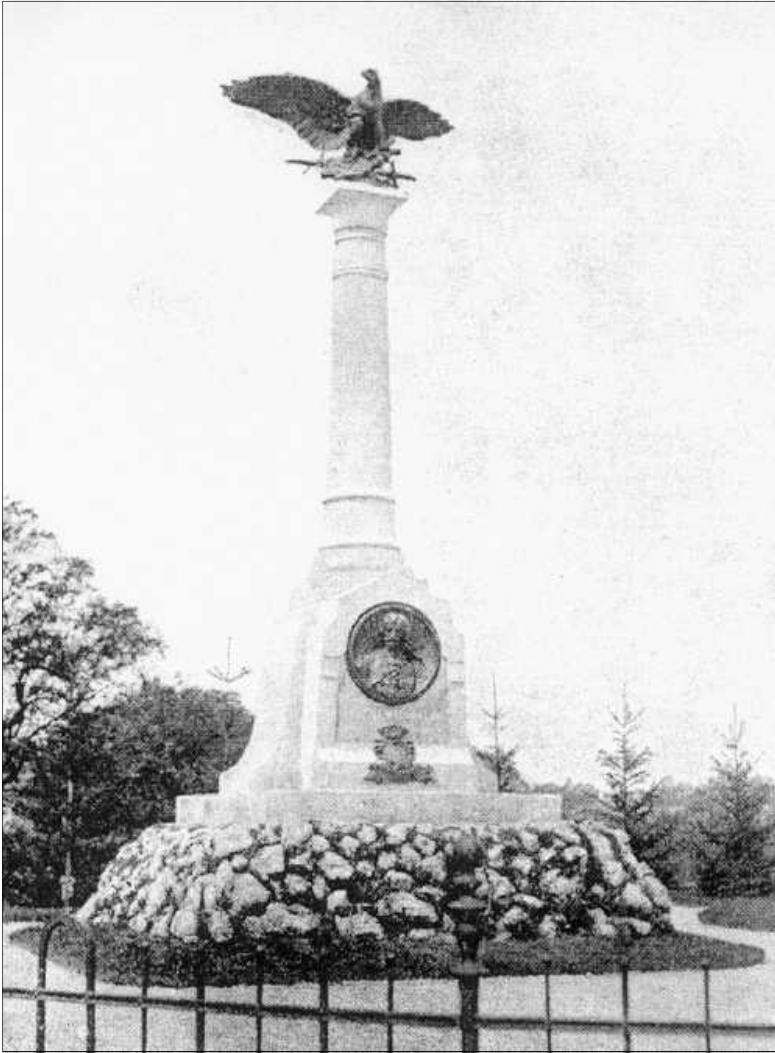
4. kép: A Zrínyi-emlékoszlop (Zrínyi Károly: Csáktornya monográfiája, 1904)

Csáktornyán régóta nem volt olyan ügy, amely iránt oly általános érdeklődést tanúsított volna a közönség minden rétege, mint a Zrínyi-emlékmű ügye iránt. Ezt a Muraköz hasábjain is leírták 1904-ben: „De hirdesse azt is, hogy itt, az imádott magyar haza kettős határán egy nép él, mely hű maradt az ő hajdani urának tradícióihoz.”