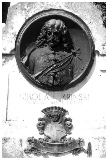
10. kép: A Zrínyi-emlékoszlop alsó talapatán levő Zrínyi-relief

A csáktornyai lapokban több ízben is írtak az 1880-as évek elején a Zrínyi-emlékoszlop felállításának szükségességéről. A helyi viszonyok azonban nem kedveztek a kivitelezésnek. 1901-ben felhívást intéztek a muraköziekhöz adakozás céljából, mivel Csáktornyán még nem volt Zrínyire emlékeztető tábla, amely a hadvezér és a költő emlékét