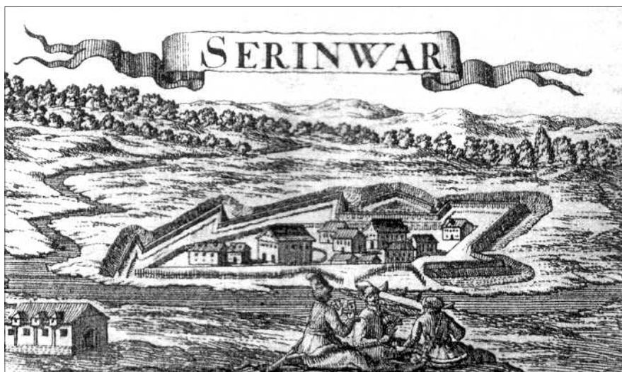
9. kép: Zrínyi-Újvár, Justus van der Nypoort rézkarca. 1686

lott hajdan az Új Zrínum lakosaival.” Az ősrégi Zrínum, ahonnan a Zrínyiek nevüket származtatják, nem volt más vidéken, mint Horvátország határszélén, a Vuna folyó közelében, ott, ahol most Zrinsko polje (Zrínyi mezeje) található. Bombardius véleménye szerint téves az az állítás, hogy az Új Zrínumot az ősrégi Zrínum mellett építették volna.