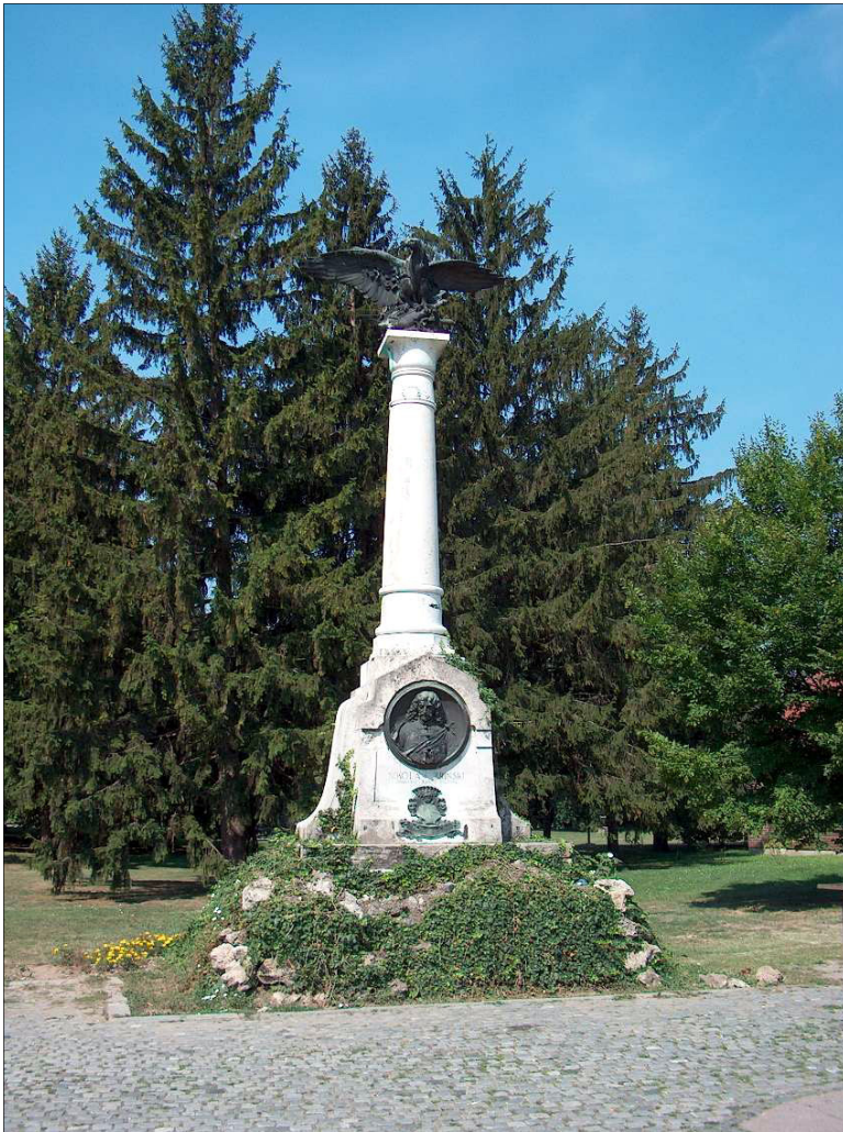
5. kép: A Zrínyi-emlékoszlop (Papp József felvétele, 2003)